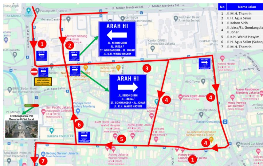
Gambar 1 Pengalihan Lalu Lintas Arah Monas Menuju Bundaran HI Selama Pembongkaran Girder Sisi Timur JPO Thamrin 10